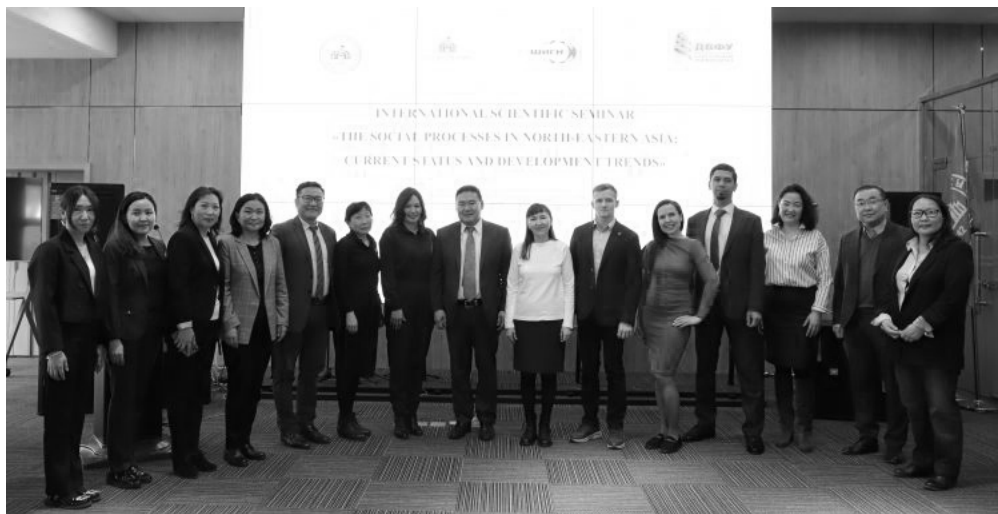
Фото 1. Участники научного семинара "Социальные процессы в Северо-Восточной Азии: современное состояние и тенденции развития".

Foto 1. Participants of the scientific seminar "Social processes in Northeast Asia: current state and development trends".