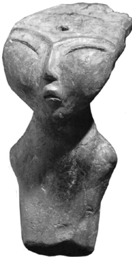
Фото 2. "Кондонская Нефертити" или "Амурская Венера". Антропоморфная скульптура. Кондон.

Анкетирование показало большую вовлеченность коренных жителей в прошлое своего района. Значительная работа по распространению таких знаний у населения лежит на плечах местных краеведческих музеев, которые при этом зачастую не располагают собственным зданием и имеют очень