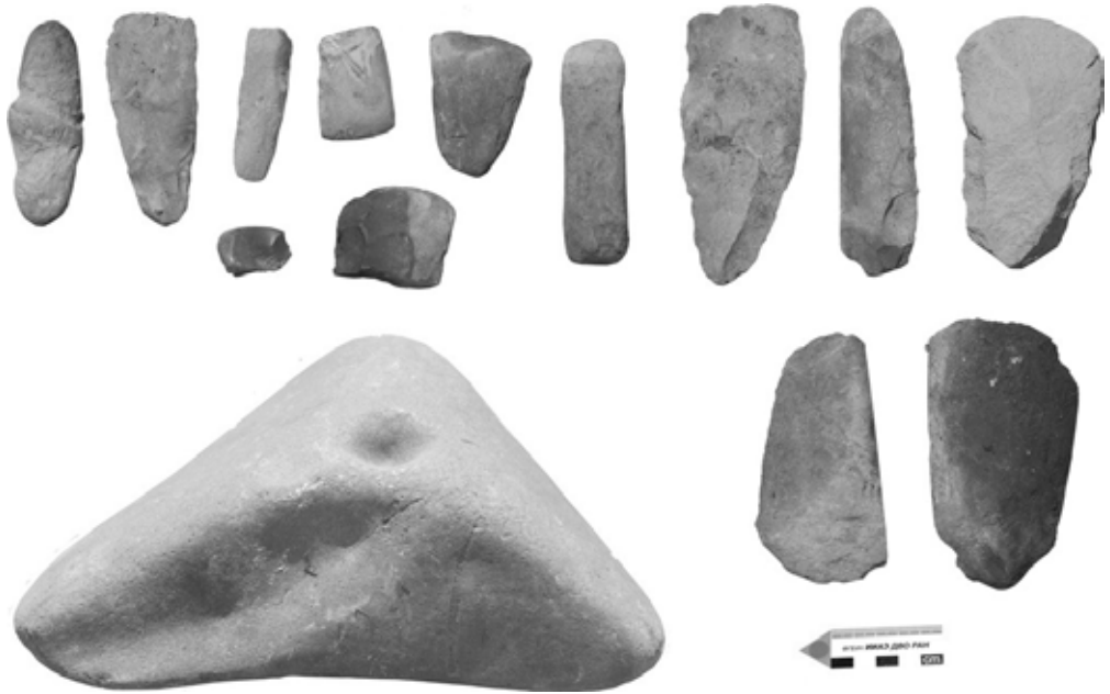
Фото 1. Подъемные сборы жителя с. Кондон. 2019 г. Photo 1. Surface finds a resident of the village of Condon. 2019.

паводков и подтопления части территории села. Например, во время экспедиции Амурского этнологического отряда ИИАЭ ДВО РАН в 2019 г. сотрудникам лаборатории Северной Пасифики жителем села Кондон была показана коллекция артефактов, собранных на собственном участке. Предметы представлены шлифованными и ретушированными теслами, имеются нуклеус, грузило, а также крупный камень с просверленным углублением ( фото 1 ).