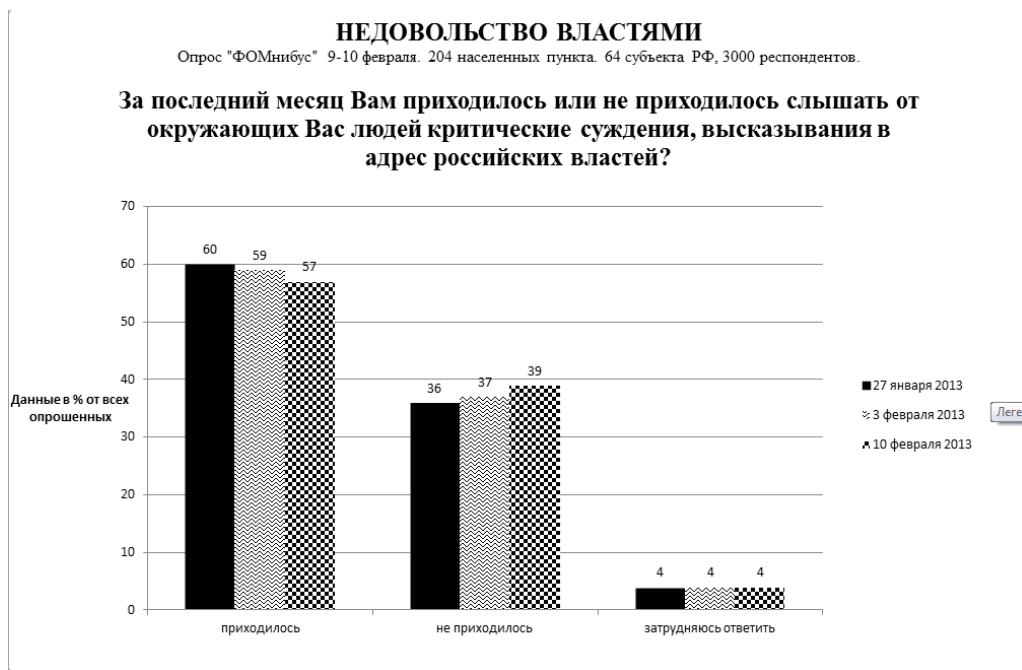
Диаграмма 1. Результаты исследования недовольства населения властями в РФ.