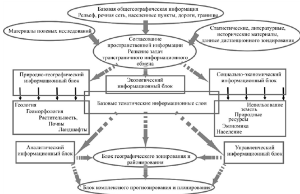
Рис. 1. Принципиальная блок-схема геоинформационного обеспечения геоэкологических исследований в бассейне р. Амур

Возрастающая антропогенная нагрузка в бассейне р. Амур сказывается на значительном преобразовании различных компонентов природы. Так, например, строительство дамб и плотин приводит к тому, что ниже по течению меняется периодичность, длительность, интенсивность паводков, а также полностью или частично пресекается твёрдый сток . От паводков во многом зависит динамика растительных сообществ