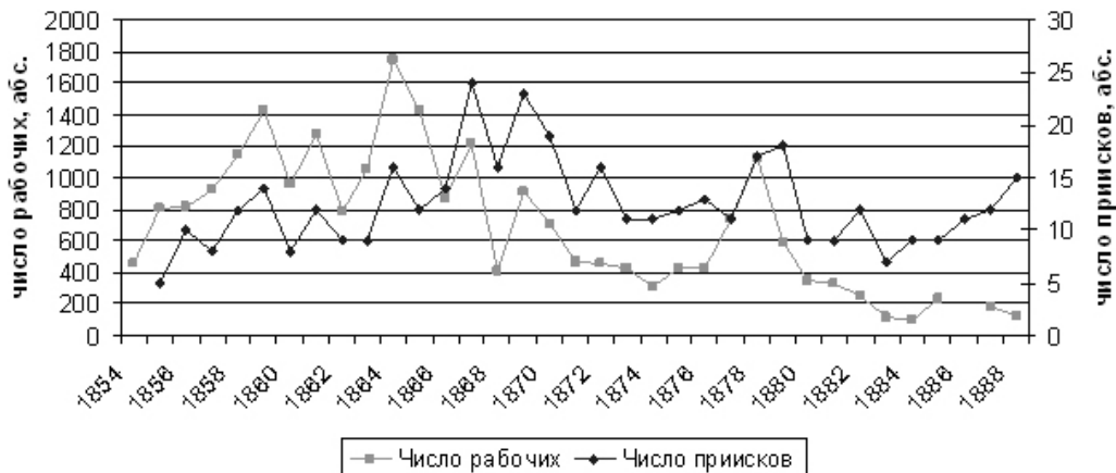
Рис. 1. Динамика числа золотых приисков Чикойской системы и количества рабочих (1854-1888 гг.).

по устройству прииска. Открытое золотоносное месторождение промышленник приобретал во временное пользование с правом наследования [7, с. 95]. Одним из правил добычи золота в системе реки Чикой, являлось то, что один купец не мог владеть одновременно двумя или более приисками, расположенными на расстоянии друг от друга в пять вёрст [3, с. 35]. По указу правительства купцам можно было эксплуатировать прииск в течение года, затем снова оформлять надлежащие документы на добычу золота на этом же прииске, если россыпи были перспективными для дальнейшей разработки.