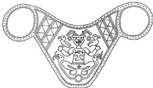
Рис. 1. Золотая чеканная нагрудная пластина тайрона с изображением солярного божества или жреца-имперсонатора (по [4, p. 371, Fig. 7.5])

памятники на этой территории были разграблены. Изделия из золота встречаются в могилах и тайниках (под платформами домов, к примеру), они были найдены в Гайраке, в Лос-Наранхос, в Пуэблито, Буритака. В погребальной практике социальное и имущественное неравенство могло маркироваться количеством и качеством украшений и votивных предметов из драгоценных материалов.